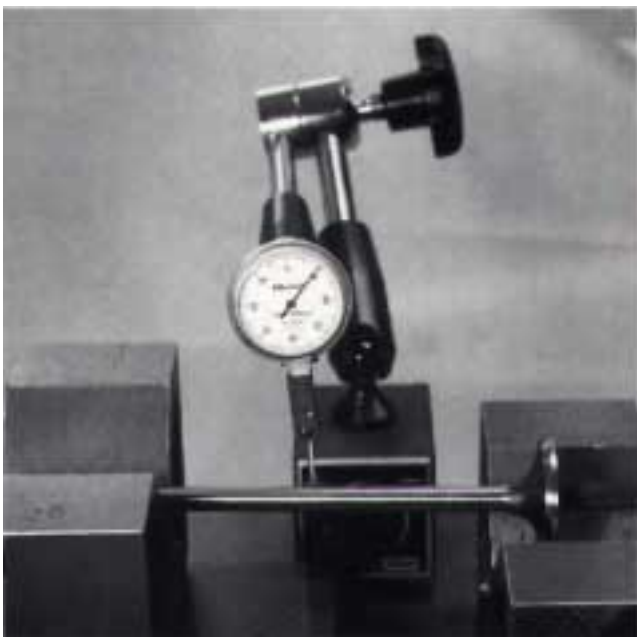
Ventilschaft-Prüfung auf Prismen