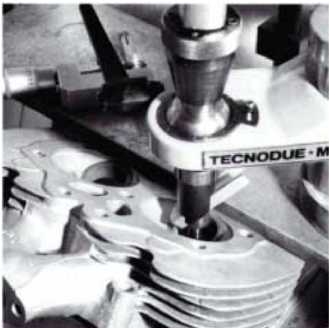
Ventilsitzfräsen mit dem Einmessergerät