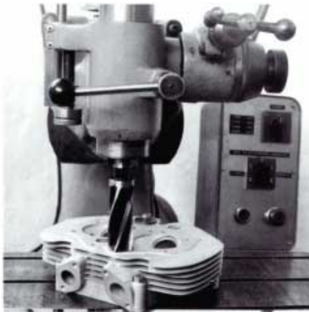
Planfräsen eines BSA-Zylinderkopfes

um großen taiwanischen Büroklammerdraht, zu Spulen gewickelt, handeln sollte. Auto- und Motorradventilfedern von anderen Herstellern, oft mitsamt deren Federtellern waren die Lösung. Inzwischen sind brauchbare Federn (Drehzahlfestigkeit u. Lebensdauer) "über die Theke" zu bekommen. Menschen mit Vorliebe für eine "wilde Nocke" bleibt bisweilen nur übrig, eine Fremdfeder zu nehmen, um die Ventilbeschleunigung in den Griff zu bekommen. Das setzt natürlich voraus, dass man von der projektierten Feder eine Kennlinie aufnimmt und anhand der Nockenwelle die V-Beschleunigung bestimmt. Eine zu stramme Feder stresst nicht nur Nockenwelle und Übertragungsteile – vom eventuellen Bruch ganz zu schweigen – sondern kostet auch Leistung.